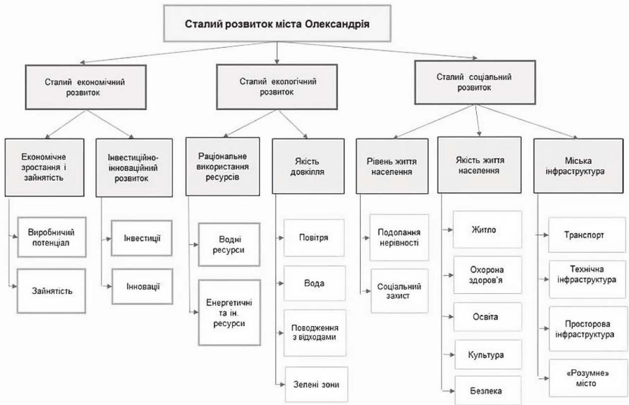
Стратегія сталого розвитку міста Олександрія до 2030 р.

розроблення в Україні стратегії сталого розвитку міст в контексті Цілей сталого розвитку на період до 2030 р. Ініціативу Олександрії було підтримано експертами Європейської Економічної Комісії ООН і практиками з питань трансформації міст у «стале смарт-місто» з огляду на те, що Стратегія має проект трансформації Олександрії у «стале смарт-місто».